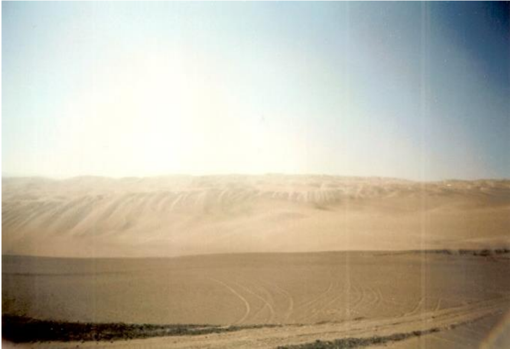
Fotografía 1. Se aprecian las Dunas de Tanaka como parte de un potencial natural sostenible en la provincia de Caravelí.